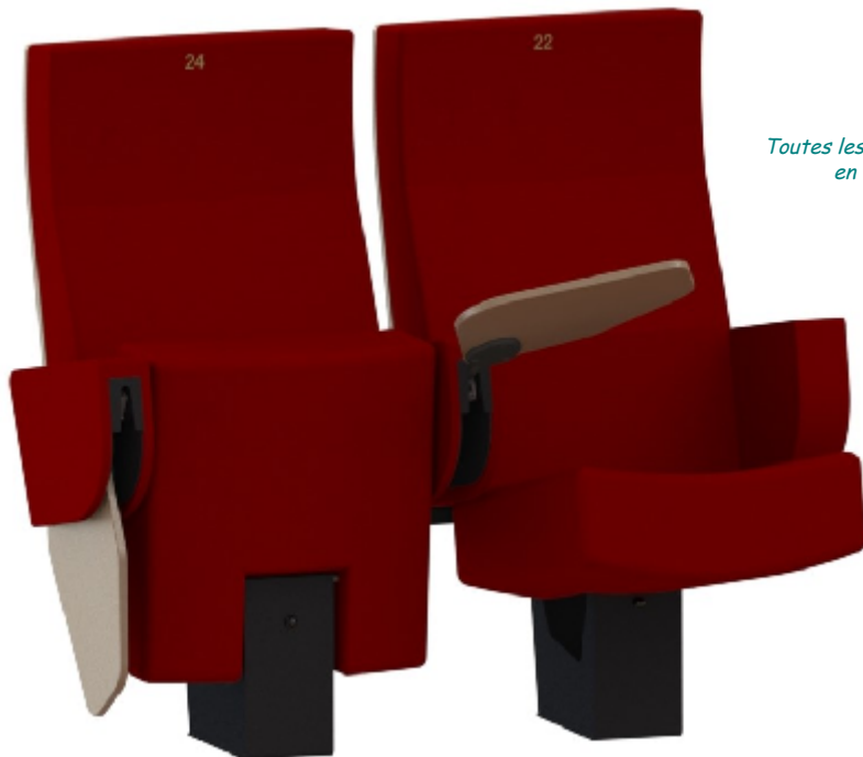
Siège à assise relevable par inertie Siège conforme à la norme NF EN 127.27

Toutes les couleurs, côtes, formes et densités peuvent être modifiées en fonction des exigences techniques et/ou esthétiques