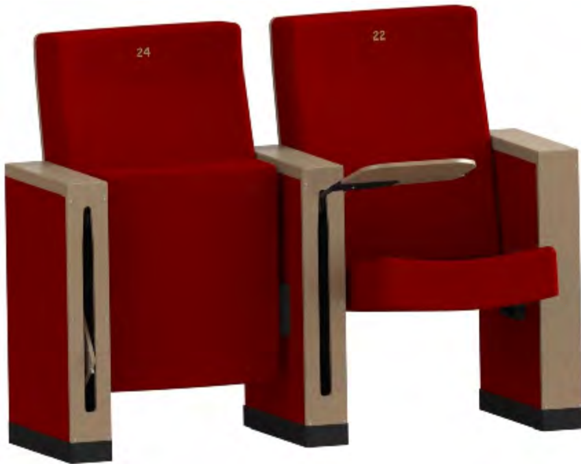
Siège à assise relevable par inertie remontée contrôlée par un amortisseur à bain de silicone

Toutes les couleurs, côtes, formes et densités peuvent être modifiées en fonction des exigences techniques et/ou esthétiques